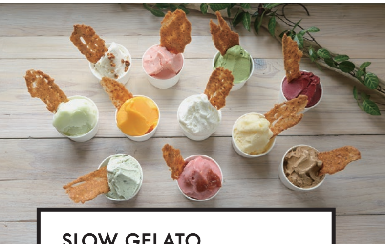
SLOW GELATO - MADE IN NONOSHIMA -