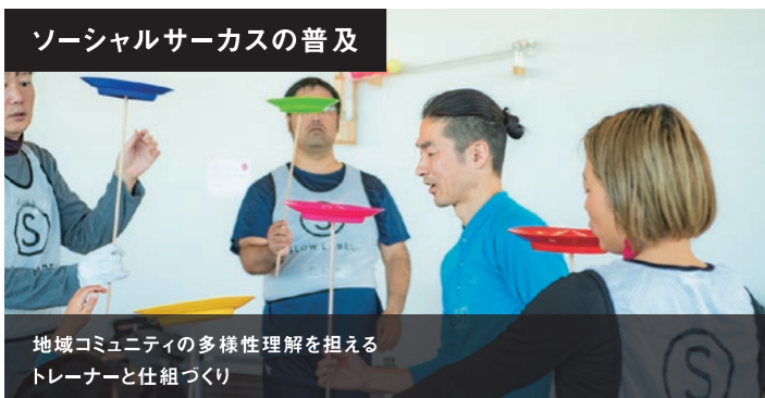
ソーシャルサーカスの普及