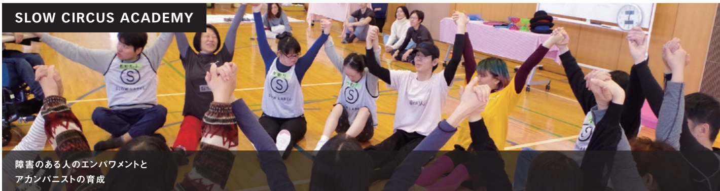
SLOW CIRCUS ACADEMY

寄付金は、認定NPO法人スローレーベルが推進する各種プログラムの運営に活用させていただきます