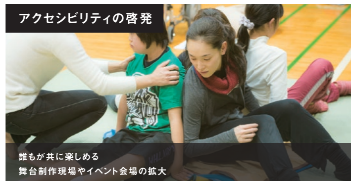
アクセシビリティの啓発