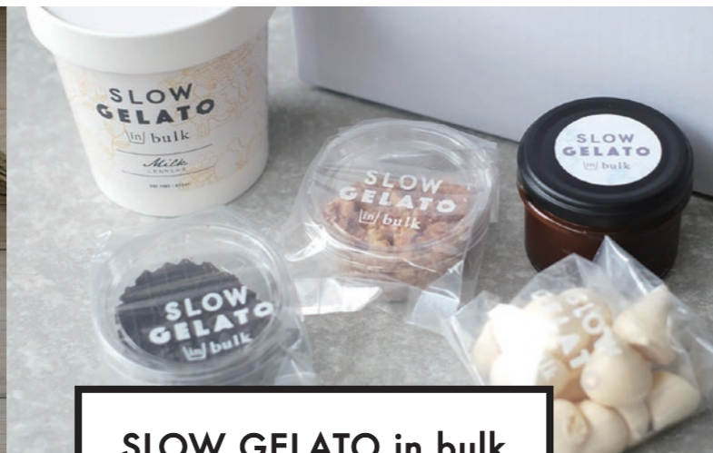
SLOW GELATO in bulk

野々島学園とフードデザイナーのモコメシさんによる、熊本県・合志市にあるジェラート店「SLOW GELATO」。熊本店のお取り寄せジェラートは、季節メニューを含めたフレーバーの詰め合わせ。様々なフレーバーを楽しめるのは熊本店のお取り寄せだけ!